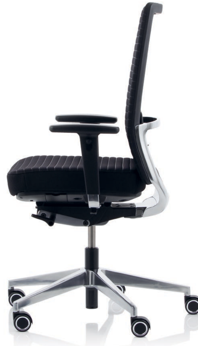
TUBE (mit met with avec KÖHL® AIR-SEAT)